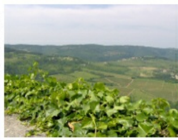
Vista panoramica dalla costa del XIII secolo della città di Montona in Istria

Per la XVIII Settimana della Cultura Scientifica e Tecnologica del MIUR - Ministero dell'Università e della Ricerca, la SISAEM - Società Internazionale per lo Studio dell'Adriatico nell'Età Medievale, in collaborazione con Medievo Italiano Project e Drengo Srl, presenta il Seminario di studio "Scienziati ed Umanisti nella 'Serenissima' tra Medioevo ed Età Moderna" rivolto agli Studenti delle scuole secondarie.